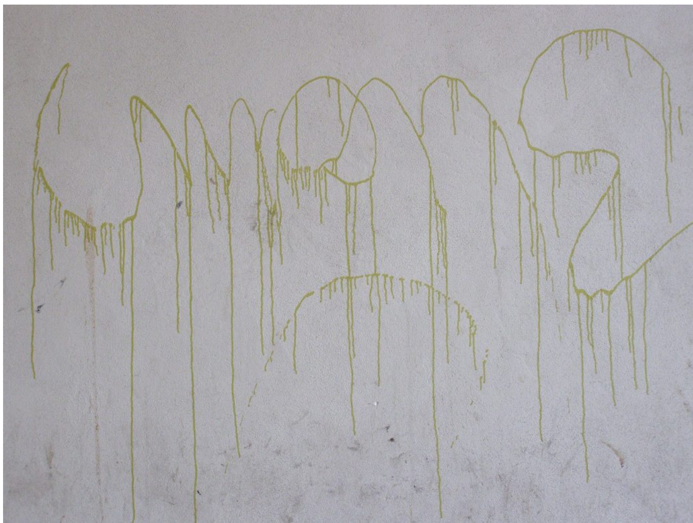
Jozef Ridilla: V horách šialenstva, 2013