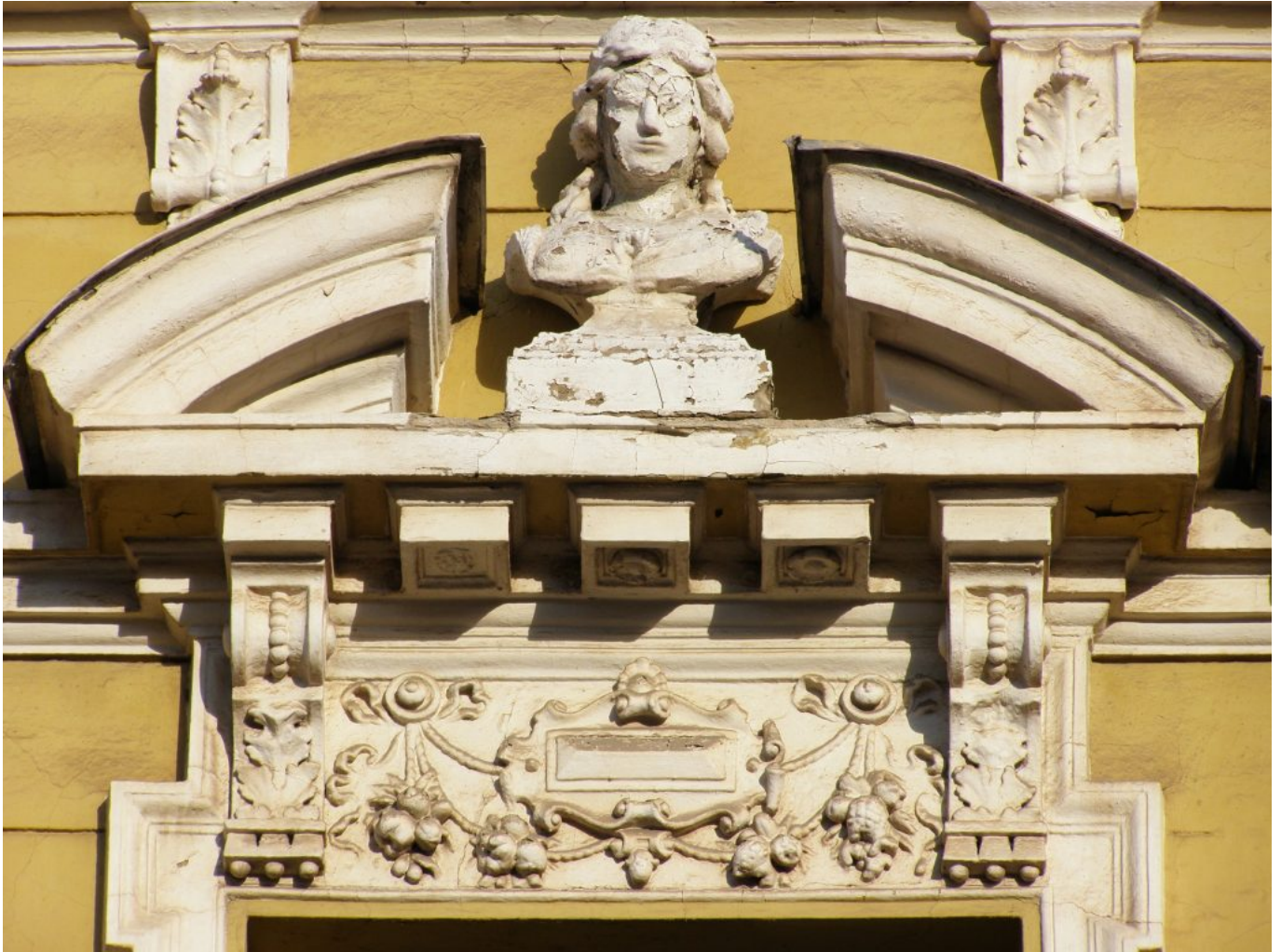
Jozef Ridilla: Zánik rodu Usherovcov 2, 2013