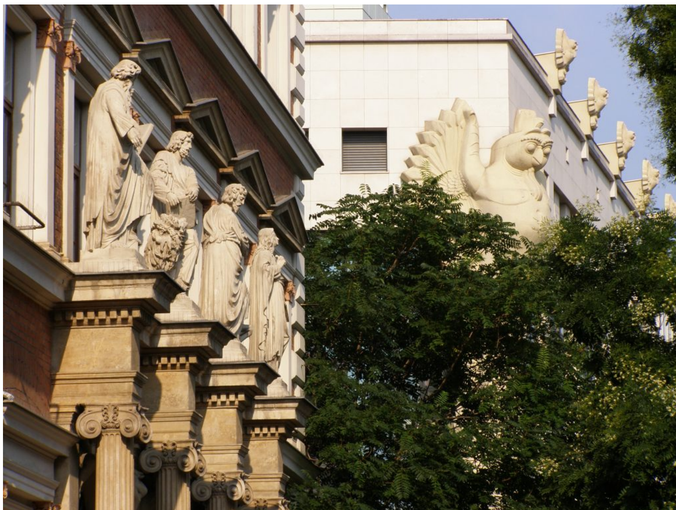
Jozef Ridilla: Melanchólia cisárskeho mesta, 2015

Posledná štvorica zachytáva intímne mestské zátišia (Bratislava, Rožňava, Košice). Ide o čistú, neestetizovanú apropráciu reality, kde objekt záujmu (objet trouvé) je situovaný do centra kompozície, keďže z hľadiska charakteru vytýčenej sémantiky je všetko ostatné podružné.