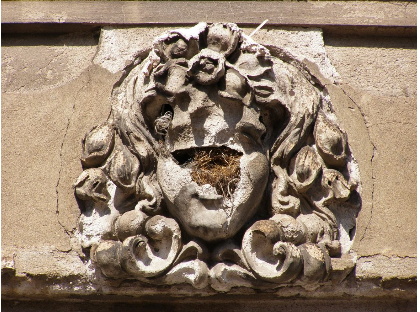
Jozef Ridilla: Zánik rodu Usherovcov 8, 2014

Ďalšie štyri fotografie majú formu mestského interiéru (Spišská Nová Ves, Zvolen, Viedeň, Paríž) a neprítomnosťou človeka v urbánnom prostredí reflektujú klasické metafyzické umenie.