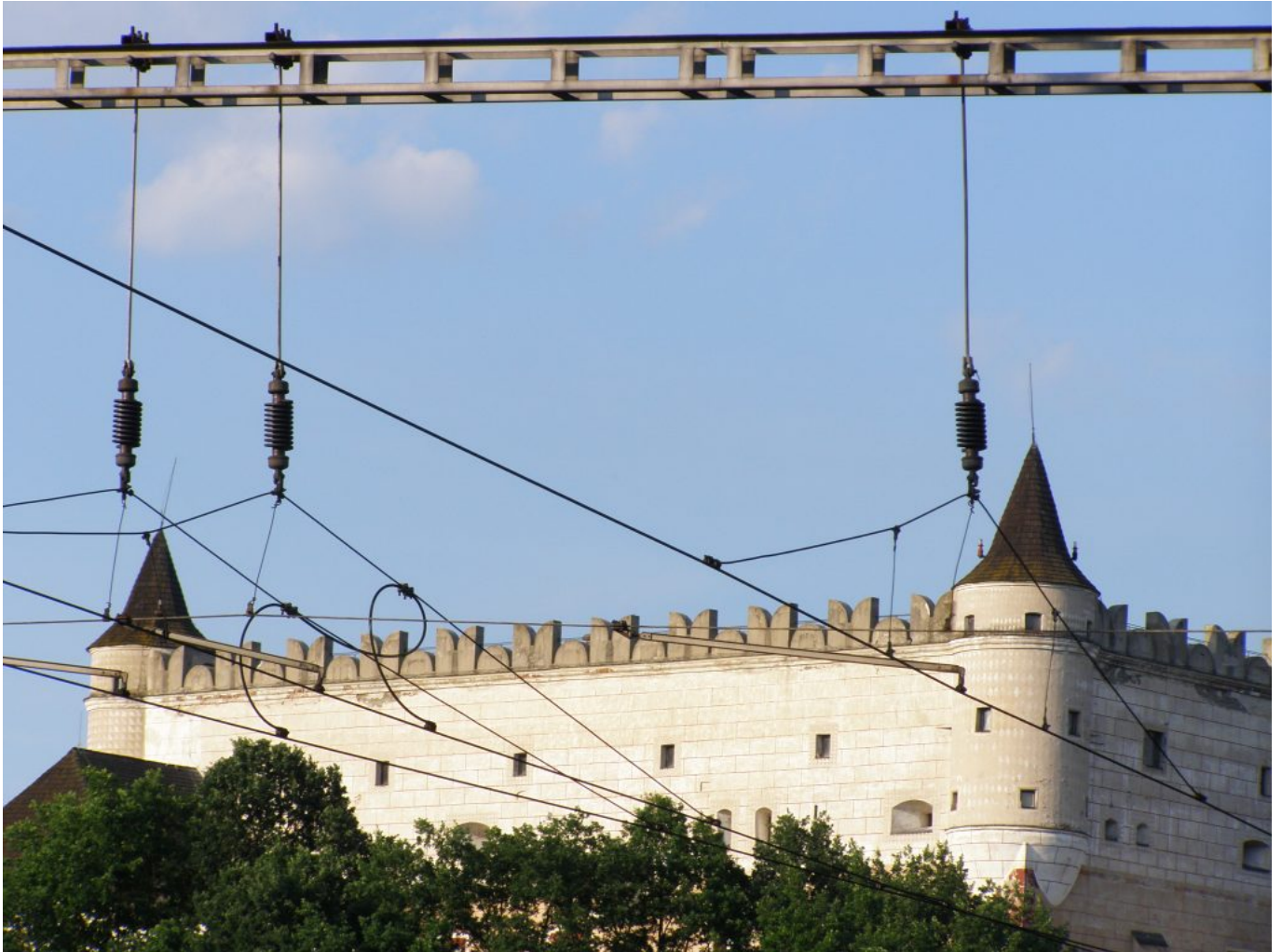
Jozef Ridilla: Melanchólia odchodu, 2013