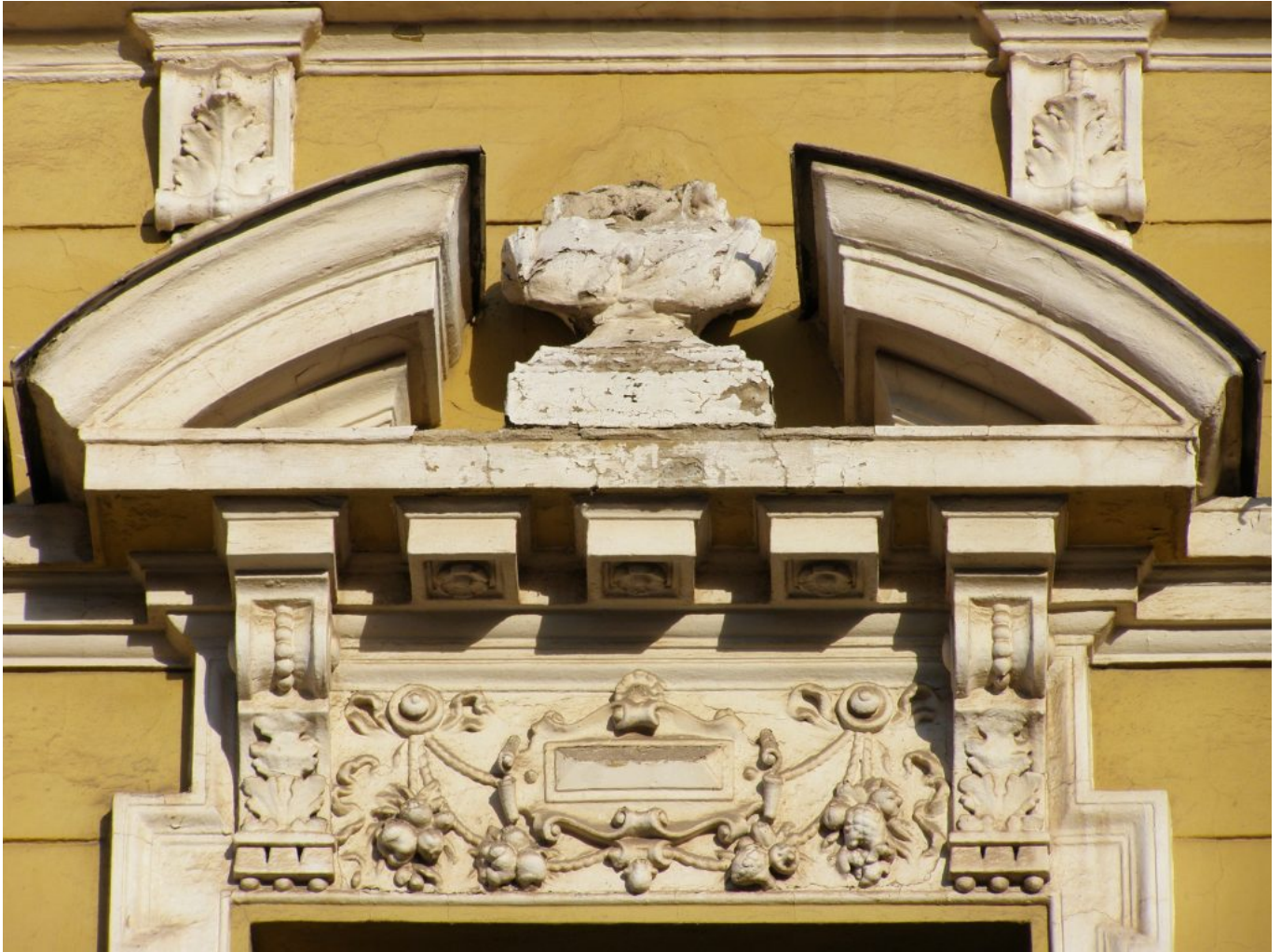
Jozef Ridilla: Zánik rodu Usherovcov 4, 2013