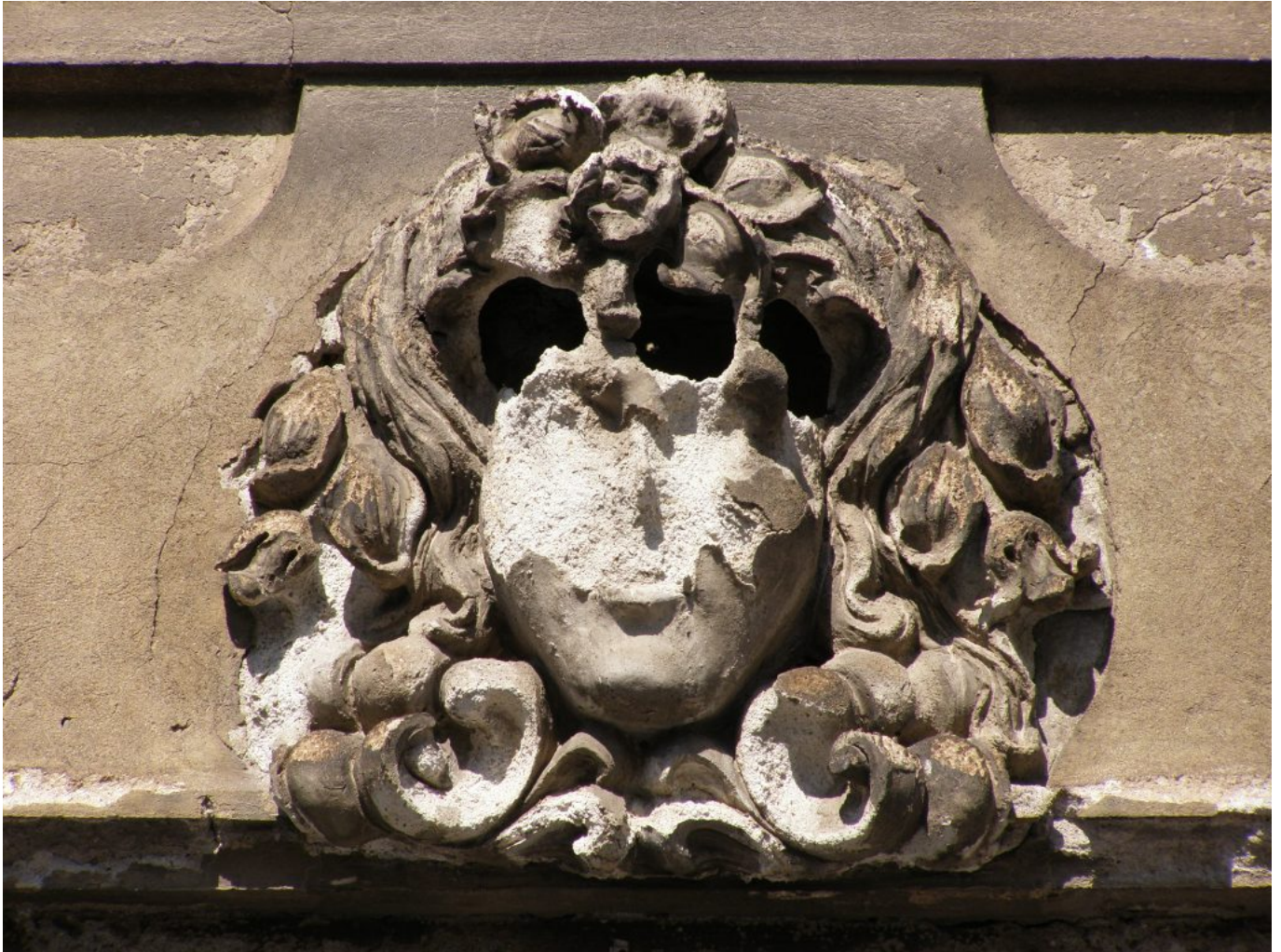
Jozef Ridilla: Zánik rodu Usherovcov 7, 2014