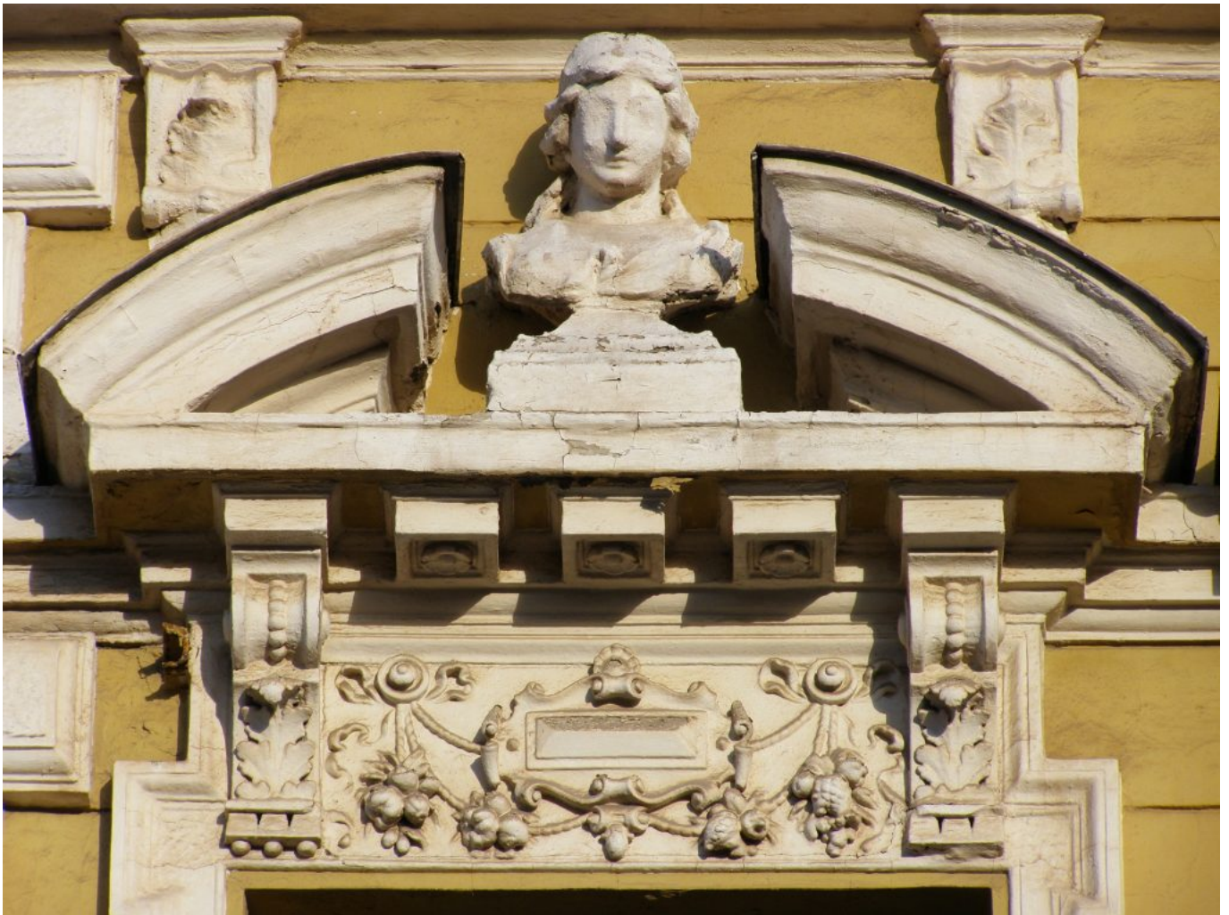
Jozef Ridilla: Zánik rodu Usherovcov 1, 2013

Dve sekvencie po štyroch fotografiách interpretujú slávny Poeov príbeh v intenciách poetiky zániku informácie na plagátovej stene. Štukové antropomorfné detaily v renesančnom a secesnom štýle (racionálna a iracionálna stránka vnímania) tematizujú entropiu ako bolestivý i očistný rituál.