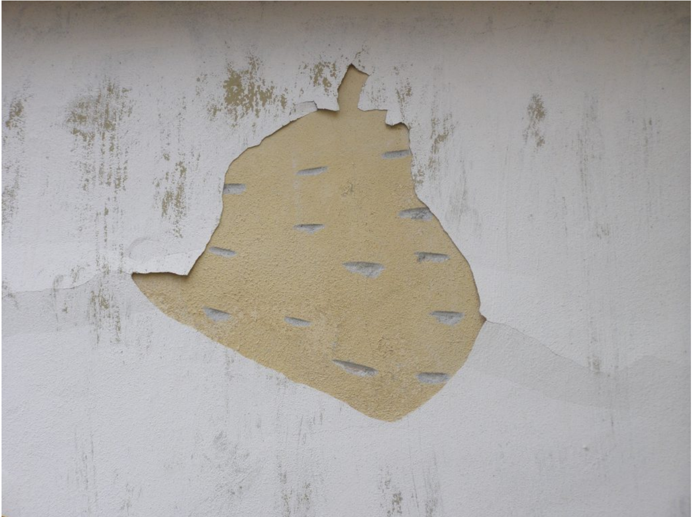
Jozef Ridilla: Krajina úsmevov, 2017