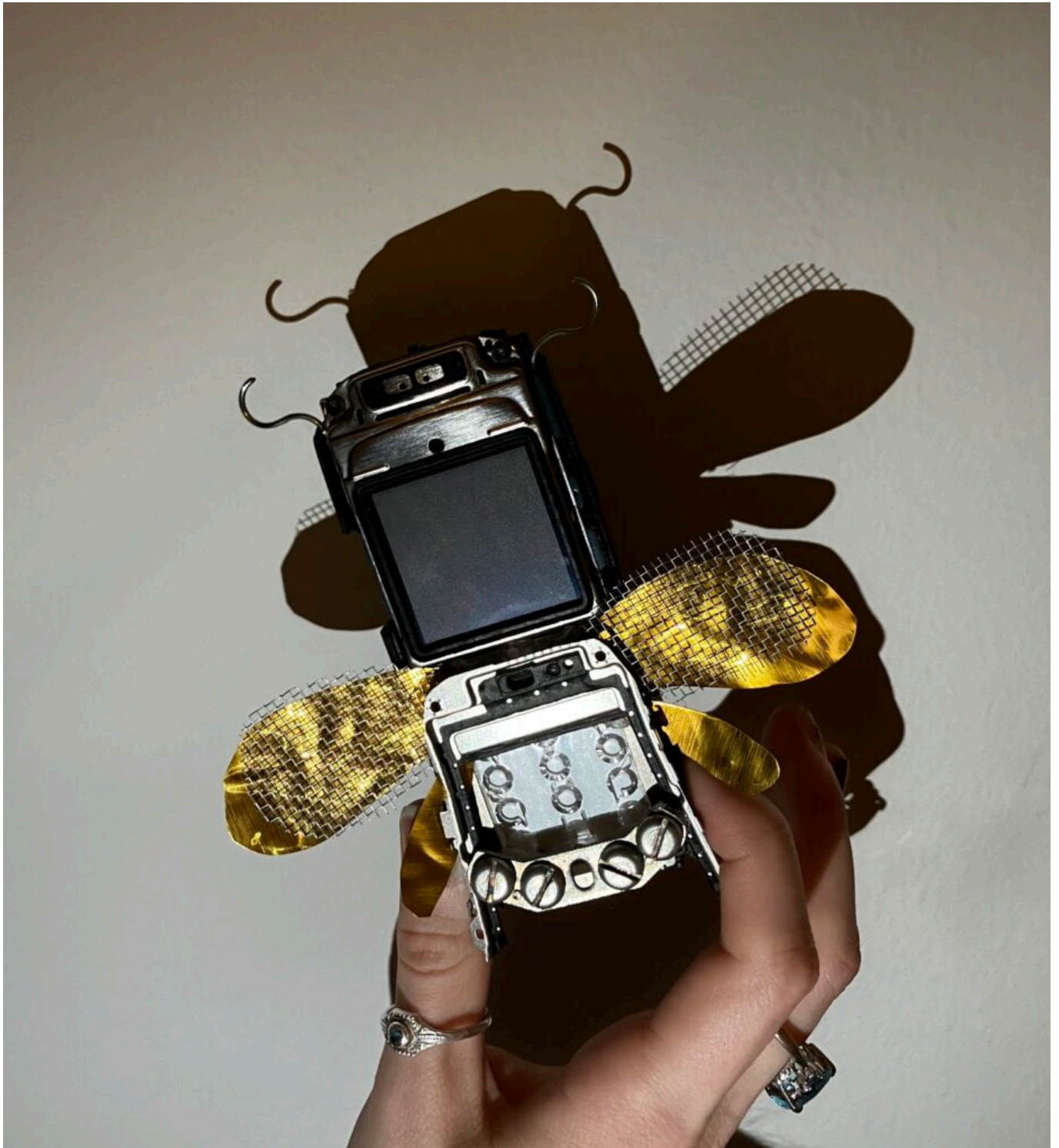
Lietajúci hmyz vytvorený zo starej Nokie (2025)