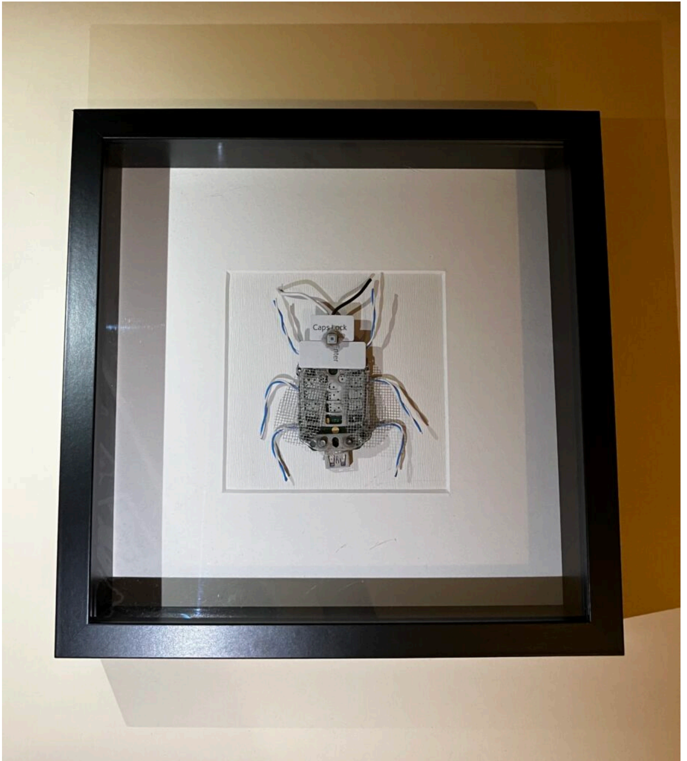
Hovnivál z počítačových a telefónových komponentov (2024)