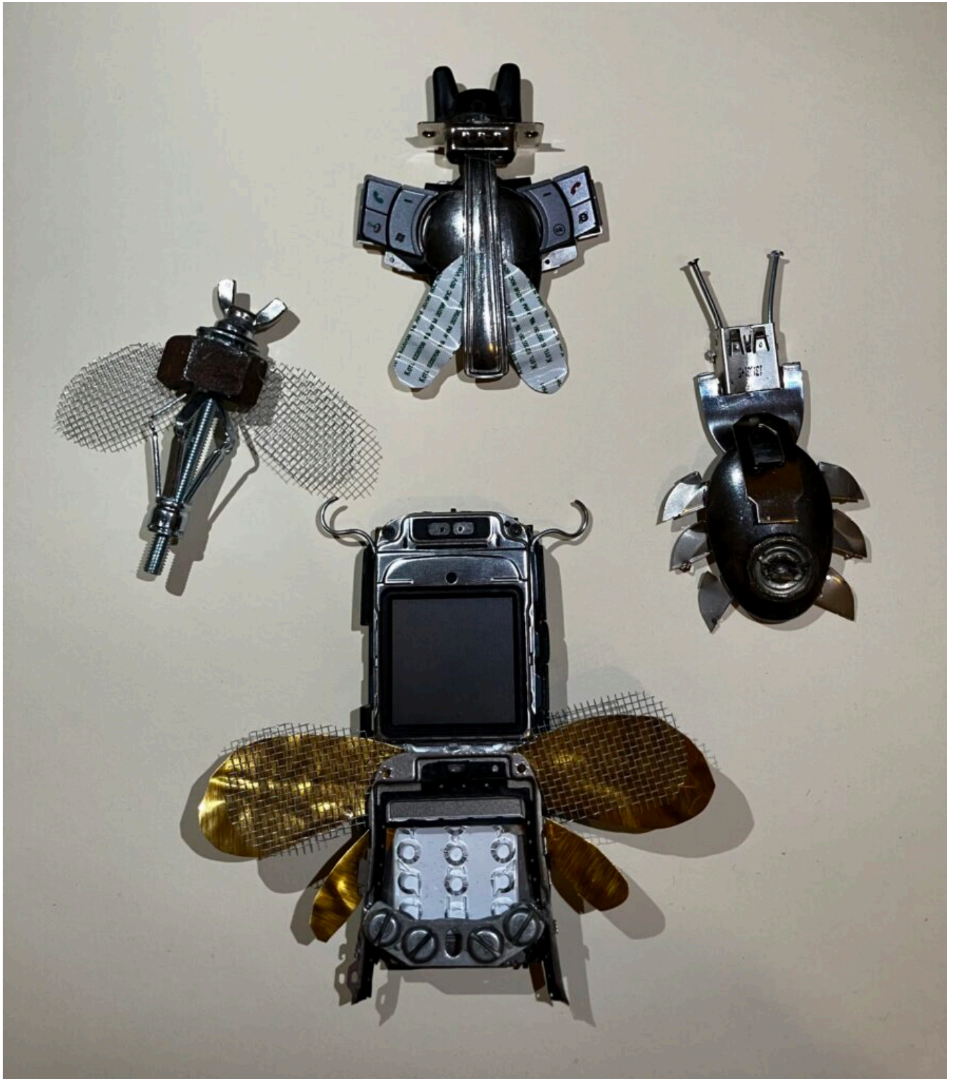
Séria hmyzu z rôznych komponentov: napríklad príbor, telefóny (2025)