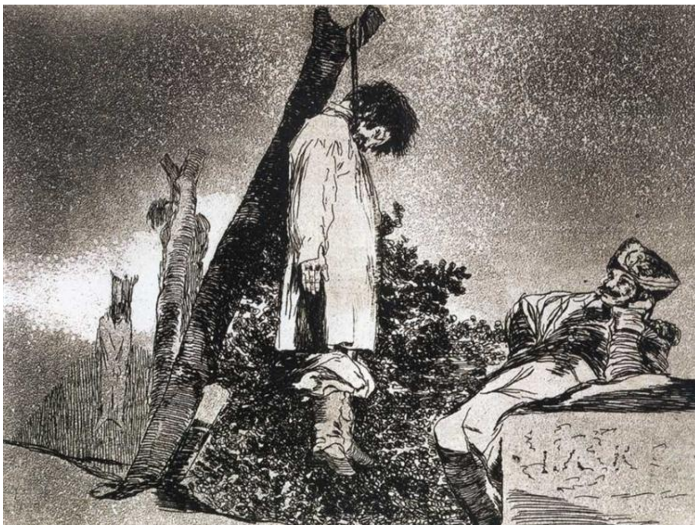
Francisco Goya (1746 - 1828): Tu nie (1812 - 1815).