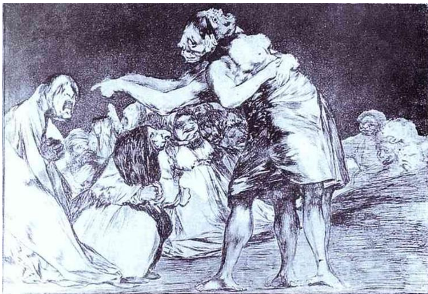
Francisco Goya (1746 - 1828): Neusporiadaný (1819).

Z cyklu Disperate (Zúfalé). Zdroj: Public Domain.