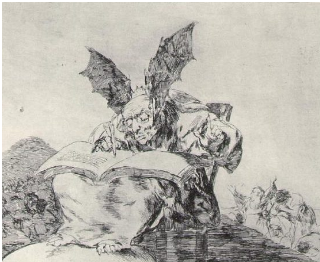
Francisco Goya (1746 - 1828): Proti spoločnému dobru (okolo 1810 - 1815).

Dav chce byť vedený, ale tak, aby mal dojem, že vedie. Nechce byť slobodný, chce len robiť, čo si zmyslí, za slobodný chce byť považovaný. Davový človek „ privykol neodvolávať sa na nijakú inštanciu okrem seba . Je spokojný sám so sebou. Naivne a bez samolúbosti bude pokladať a vydávať za dobré všetko, čo nachádza v sebe: názory, chůtky, záľuby a vkus. A prečo nie, keď... ho nikto a nič nenúti uvedomiť si, že je človekom podradným, krajne obmedzeným, neschopným vytvoriť a udržať samotnú organizáciu, čo poskytuje jeho životu šírku a spokojnosť, o ktoré opiera utvrdenie svojej osoby?“ 2 .